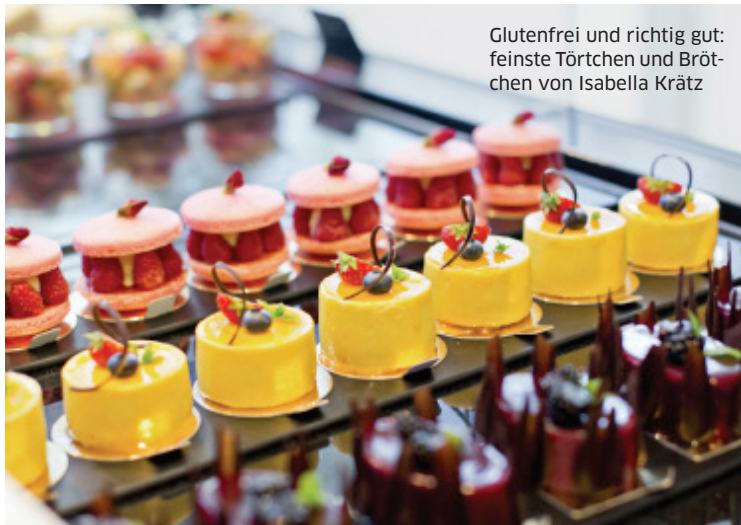
Glutenfrei und richtig gut: feinste Törtchen und Brötchen von Isabella Krätz